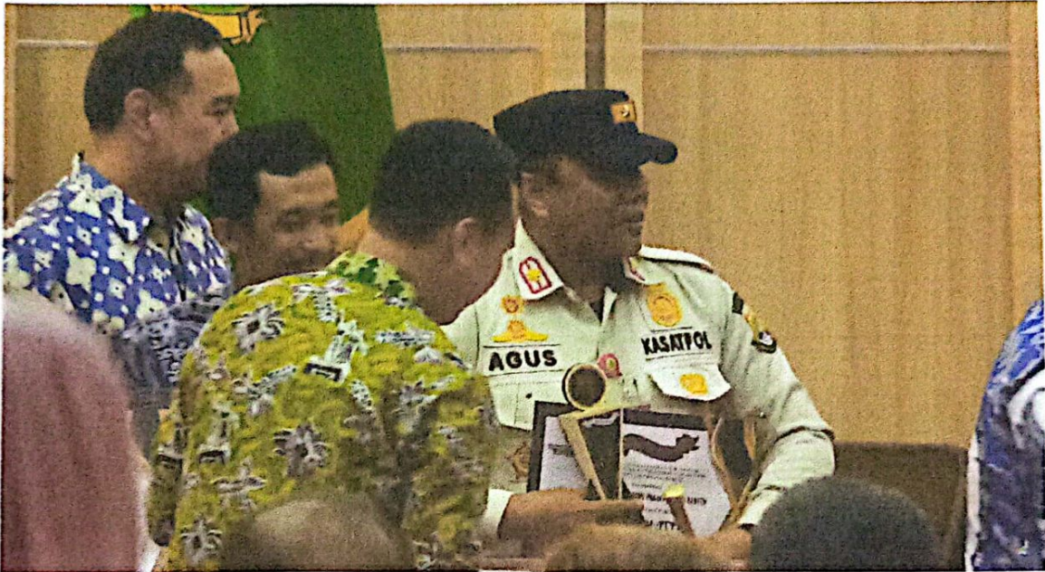
Gambar 1.3 Kasatpol PP Provinsi Banten menerima penganugerahan Keterbukaan Informasi Tahun 2023

Satuan Polisi Pamong Praja Provinsi Banten mendapatkan penghargaan dari Komisi Informasi Provinsi Banten yaitu sebagai Organisasi Perangkat Daerah (OPD) terinovatif Tahun 2023, itu merupakan capaian dan bentuk kerja sama PPID Pelaksana Satuan Polisi Pamong Praja Provinsi Banten baik internal maupun eksternal dengan OPD lainnya demi tercipta capaian Informasi Publik yang terbuka dan akuntabel.